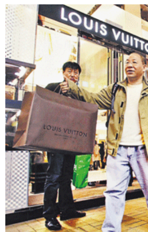
北方商人少有機會接觸廣東其文化認知不多，若能學好化背景，就能減少溝通障礙（資料圖片）