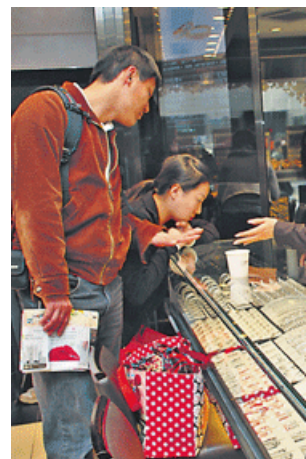
港人學習能力高，然而普通話者，也未必清楚內地營商及掌握及適當運用普通話，可首要的課題。

兩地人溝通欠順，「蝦碌」事件屢見不鮮，如把廣東話「巴士」譯為「公車」，然而「公車」在內地也可解作「公家／公司的車」，而不一定指公共汽車，忽略詞彙用法就會顯得失禮。朱硯梅稱，港人普遍接受西方文化，尤其經商客都以為西方一套可直接套用在內地營商環境上，就极易產生誤會：「內地商人對合作夥伴都很熱